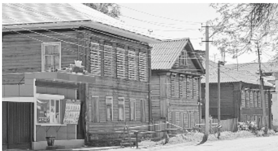
Исторический центр, улица 9 Января...

Программа «Переселение граждан, проживающих на территории Новгородской области, из аварийного жилищного фонда 2013-2017 гг.» дала возможность жильцам домов № 48, 50 и 52 по ул. 9 Января получить новое благоустроенное жильё. В декабре 2015-го опустели 50-й и 52-й дома, а последний житель 48-го выехал в январе 2017 года.